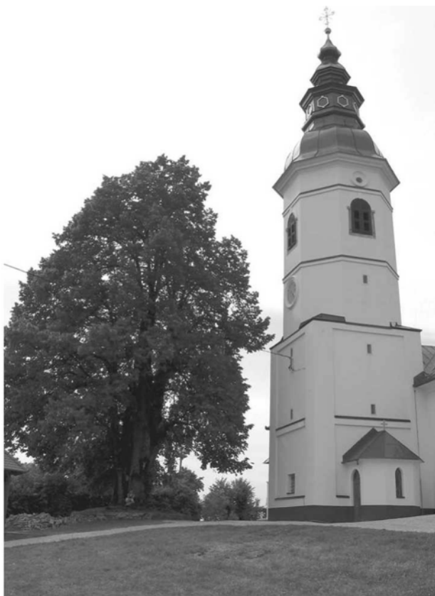
Cerkev in lipa na Primskovem, 2005, foto Nena Židov

dar; / .../” 80 Menil je, da ima v sebi neki magnetizem, neki eteričen fluid, ki se da prenesti na drugo osebo in ki toliko vpliva na njegove živce, da ozdravi nekatere bolezni. 81 “Ko bi jaz ne bil duhovnik, bi me morebiti ljudje sodili, da sem z vragom v zvezi, zdaj pa vendar mislijo, da z vragom nimam nič opraviti.” 82